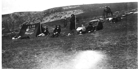
Els excursionistes ripollesos a pla Guillem, anant de la Presta al Canigó.